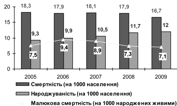
Мал. 2. Динаміка показників загальної та малюкової смертності порівняно з народжуваністю серед населення Київської області