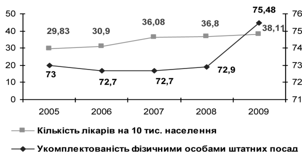
Мал. 4. Динаміка показників забезпеченості населення лікарями та укомплектованості посад лікарів у Київській області