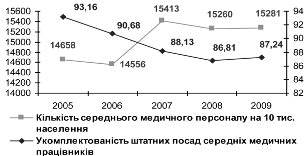
Мал. 5. Динаміка показників забезпеченості населення молодшим медичним персоналом та укомплектованості їхніх посад у Київській області

( r=0,9341 ; p=0,020 ). Хоч кількість середнього медичного персоналу поступово зростає, укомплектованість відповідних посад залишається недостатньою, що може свідчити про відносний дефіцит медичних кадрів у Київській області, особливо щодо середнього медичного персоналу (мал. 4, 5).