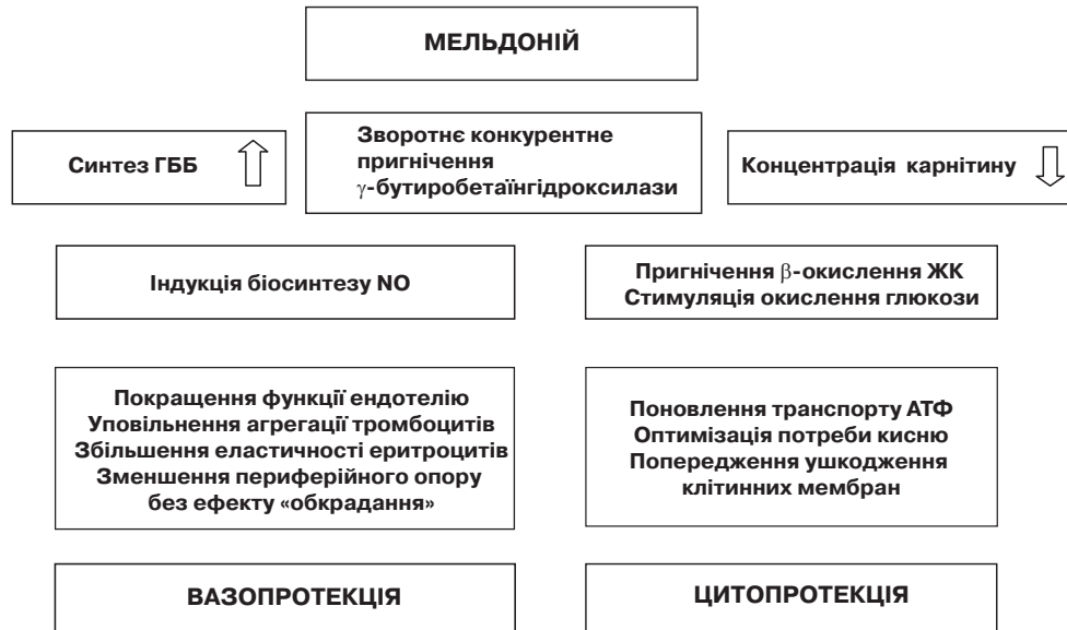
Мал. 2. Схема механізму дії мелідонію

дині клітини (на цьому ґрунтується механізм дії інших препаратів). Додатковий вплив на стимуляцію глюкози для синтезу АТФ створюють передумови для більш економного і ефективного використання кисню в умовах його дефіциту.