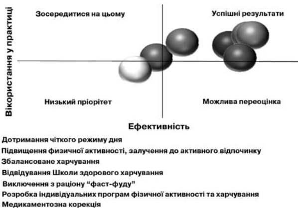
Мал. 2. Графічне зображення розподілу оцінок використання у практиці і досягнення ефективності компонентів профілактики та корекції надмірної маси тіла та ожиріння

Зіставлення двомірних розподілів «використання у практиці профілактичних втручань на поведінкові фактори ризику – ефективність профілактики/корекції НМТ/О» (мал. 2) свідчить, що із семи компонентів оцінки профілак-