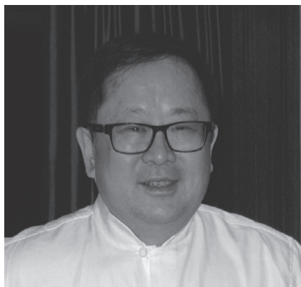
Президент WONCA World (2018–2020 гг.) Д-р Дональд Ли (Гонг-Конг, Китай)