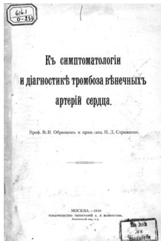
Доклад В. П. Образцова и Н. Д. Стражеско «К симптоматологии и диагностике тромбоза венечных артерий сердца», изданный в 1910 г. в Москве в типографии А. И. Мамонтова

В эти годы научные интересы В. П. Образцова сосредоточились в основном на заболеваниях сердца, описании симптомов и их клинической оценке. При этом он установил и дал характеристику некоторым особенностям первого тона, указал на возможность более раннего выявления его расщеплений, выявления «ритма галопа» и механизма его возникновения. Сообщил о существовании нормального третьего тона, который он выслушивал