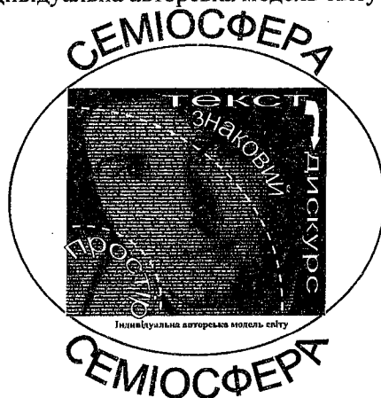
Схема 1. Індивідуальна авторська модель світу

Людина у сучасному Часі створює свій власний мовний дискурсологічний Простір, який вимагає дослідження. У ньому є свої закони, правила, формації, спосіб відтворення дійсності. За кожним текстом стоїть епістемний простір автора та образ, відфільтрований отримувачем, – все це формує дискурс у тому чи іншому інформаційному полі.