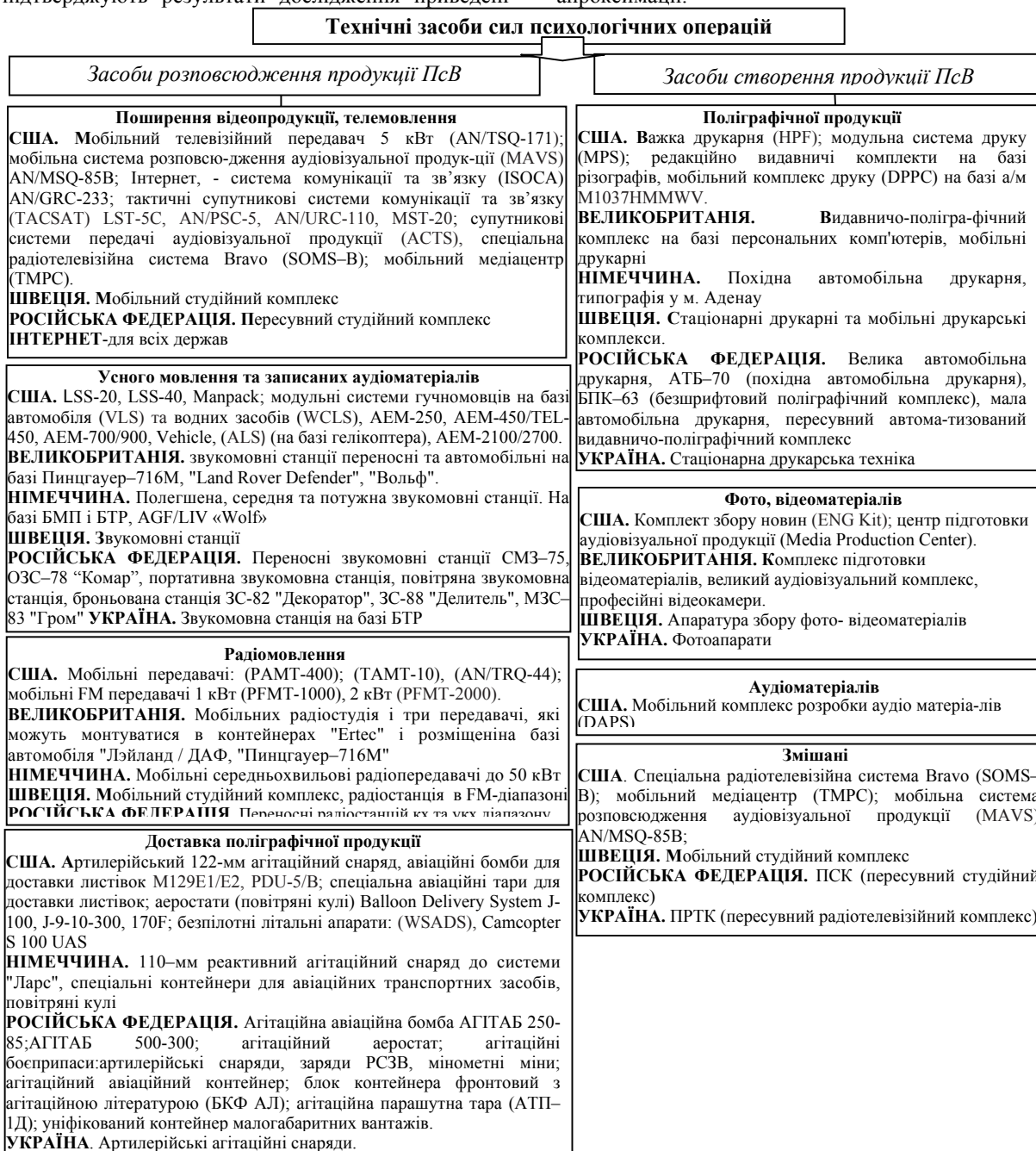
Рис.1. – Ознакова класифікація технічних засобів сил ПсО збройних сил провідних держав світу

на рис.2. Очевидно, що і в майбутніх локальних війнах та збройних конфліктах сили та засоби ПсО використовуватимуться, що підтверджує результат апроксимації.