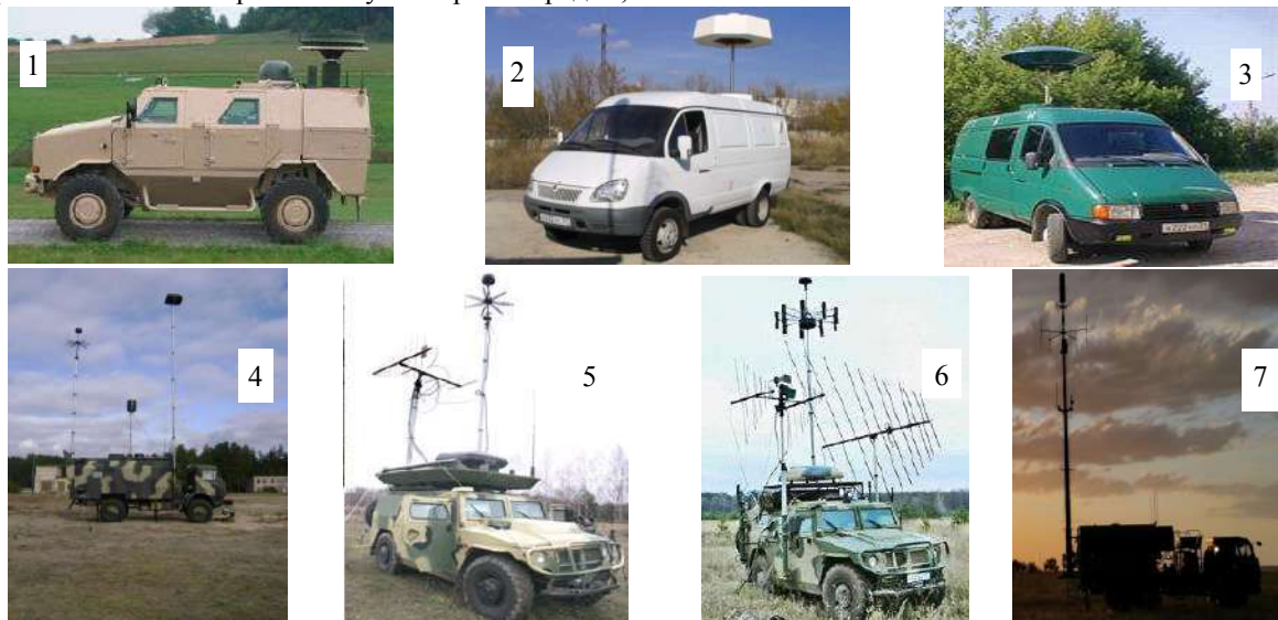
Рис. 1. Засоби і комплекси радіо-, радіотехнічного контролю 1 - Argus-M2, ФРН; 2 - «Радіан-02», РФ; 3 - «Охота», РФ; 4 - МКТК-1А, РФ; 5 - «Леер-2», РФ; 6 - «Лорандит-М», РФ; 7 - CRS-8000, Швеція

радіотехнічного контролю: Argus-M2, Rhode&Schwarz, ФРН [3]; «Радіан-02», ЗАТ «НВП «СпецРадіо», РФ [4]; «Охота», ЗАТ «НВП «СпецРадіо», РФ [4]; МКТК-1А, ВАТ «ВНДІ «Еталон», РФ [5]; «Леер-2», ВАТ «ВНДІ «Еталон», РФ [5]; «Барс-ВЧ», ТОВ «Спеціальний технологічний центр», РФ [6]; «Лорандит-М», ВАТ «НТП «Сфера», РФ [7]; «Свет-КУ», ТОВ «Спеціальний технологічний центр», РФ [6]; CRS-8000, SAAB, Швеція [8], деякі з них наведені на рис. 1.