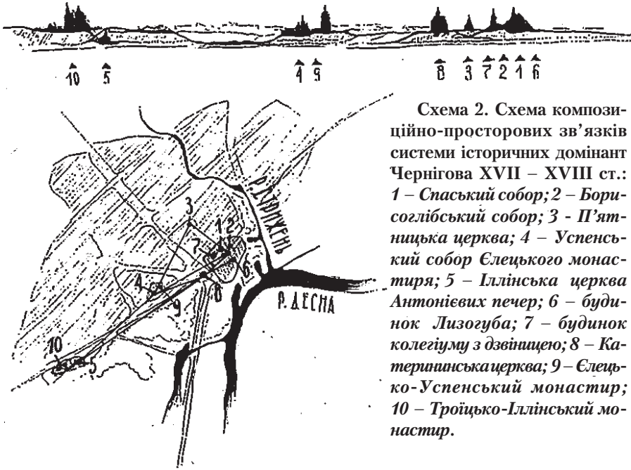
Схема 2. Схема композиційно-просторових зв'язків системи історичних доміант Чернігова XVII – XVIII ст.: 1 – Спаський собор; 2 – Борисоглібський собор; 3 – П'ятницька церква; 4 – Успенський собор Єлецького монастиря; 5 – Іллінська церква Антонієвих печер; 6 – будинок Лизогуба; 7 – будинок колегіуму з дзвіницею; 8 – Катерининська церква; 9 – Єлецько-Успенський монастир; 10 – Троїцько-Іллінський монастир.

кільцеву схему центральної частини Чернігова були включені фрагменти регулярного планування [5], яке збереглося до наших днів.