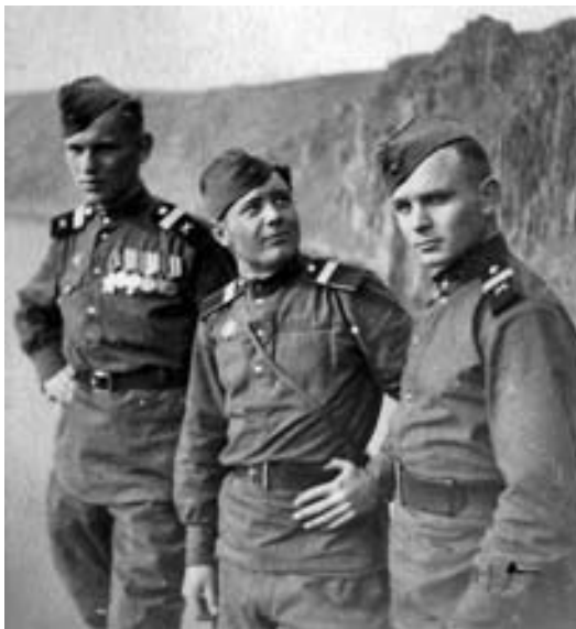
1948 р. С. Новогеоргіївка. На стрімкому березі р. Суифун разом із бойовими друзями