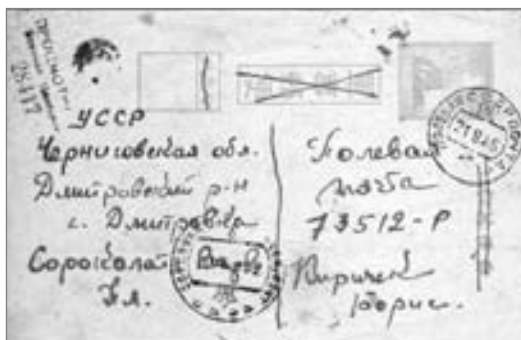
Солдатська поштова листівка 20.08.1945 р. з Маньчжурії

Один з таких документів часу, солдатську листівку, наводимо в цьому нарисі: