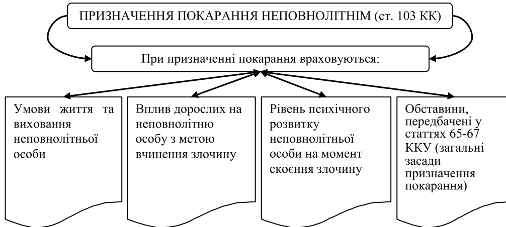
Мал. 2. Особливості призначення міри покарання неповнолітнім особам, що вчинили правопорушення згідно чинного законодавства

також слабкий контроль за ними з боку батьків, соціальна незахищеність неповнолітніх, відсутність профілактики та контролю з боку керівництва навчальних закладів, органів міліції та державних установ, на яких покладено відповідальність за створення нормальних умов існування неповнолітніх [6].