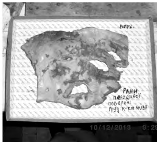
Мал. 5. Клапоть шкіри з ушкодженнями

Слід зазначити, що в цьому ж випадку при проведенні експертизи ексгумованого трупа були виявлені численні ушкодження, що не були зазначені в «Висновку» первинної судово-медичної експертизи, серед них: розруб лівої ключиці, головки лівої плечової кістки, розруби тіл 4-5 поперекових хребців, крижі, багатоуламковий перелом лопатки.