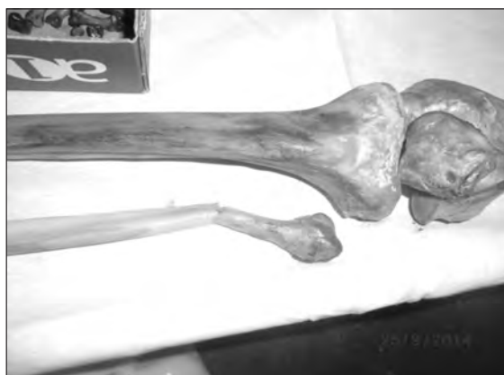
Мал. 3. Перелом малої гомілкової кістки

Досить часто важливою причиною для проведення ексгумації трупа та повторного його дослідження стають недоліки в описі морфології ушкоджень, що не дає можливості точно встановити механізм травми та викли-