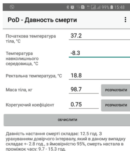
Рис. 1. Робочий інтерфейс програми «PoD –Давність смерті», основне поле

Після цього необхідно встановити температуру навколишнього середовища, шляхом вимірювання, з дотриманням відповідних умов. Після чого отримані дані необхідно ввести у відповідне поле програми «Температура навколишнього середовища».