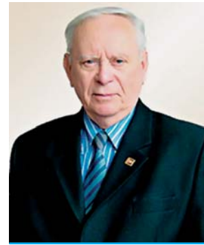
Злобін Г.К., Президент Академії будівництва України

У день ювілею прийміть найщиріші побажання колективу Державного підприємства «Український науково-дослідний і проектно-конструкторський інститут будівельних матеріалів та виробів» в досягненні нових висот і звершень, творчої наснаги у нашій загальній благородній справі – будівництві.