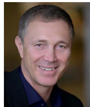
Володимир Сальдо, Заступник Голови Комітету Верховної Ради України з питань будівництва, місто- будування і житлово-кому- нального господарства та регіональної політики