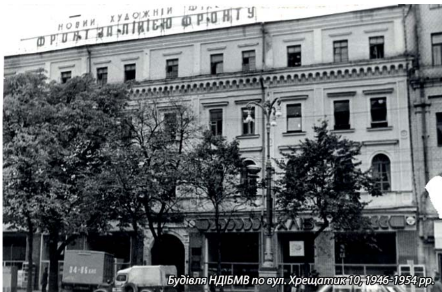
Будівля НДІБМВ по вул. Хрещатик 10, 1946-1954 рр.

З 1957 р. на базі інституту та ЦНДІБМ створено Державний науково-дослідний інститут будівельних матеріалів і виробів «НДІБМВ» («НИИСМИ»). До складу інституту входили Молдавське відділення, Львівська та Кримська філії, а з 1988 р. – відділення в містах Вінниця, Дніпропетровськ, Донецьк, Львів, Сімферополь, Харків.