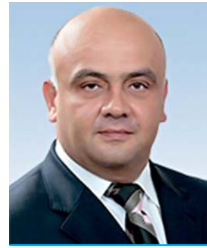
Спіридон Кілінкаров, Голова Комітету Верховної Ради України з питань будівництва, місто- будування і житлово- комунального господарства та регіональної політики

Вітаю увесь колектив та співробітників Інституту, бажаю Вам і надалі збільшувати професіоналізм та досягати нових вершин у вирішенні актуальних проблем будівельної галузі.