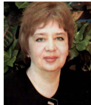
Заїменко Н.В., Директор Національного ботанічного саду ім. М.М.Гришка НАН України