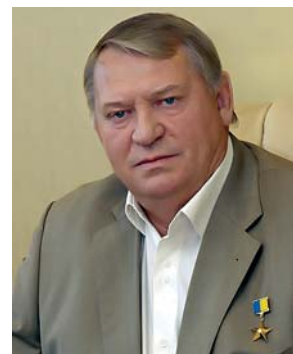
Шилук П.С., Президент будівельної палати України, Герой України

Щиро бажаю колективу Інституту постійних творчих злетів та досягнення нових вагомих перемог. Впевнений у подальшому плідному розвитку стосунків між Будівельною палатою України та Науково-дослідним інститутом будівельних матеріалів і виробів. Твердо переконаний, що попереду у нас багато спільних відповідальних проектів, реалізація яких сприятиме піднесенню рівня будівельної науки, забезпечить сталий розвиток будівництва в Україні.