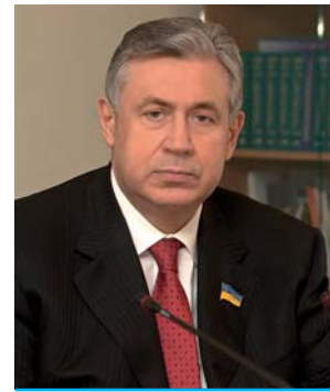
Володимир Вечерко, Перший заступник голови Комітету Верховної Ради з питань будівництва, місто- будування, житлово-кому- нального господарства та регіональної політики, голова Постійної делегації ВРУ у Парламентській асамблеї ЄС – Східні сусіди (ПА ЄВРОНЕСТ)

Тож з нагоди ювілею організації щиро бажаю Інституту нестримного руху вперед, нових напрацювань та досягнень на ниві підняття науково-дослідного потенціалу України! А працівникам та керівництву підприємства наснаги, радощів і добробуту!