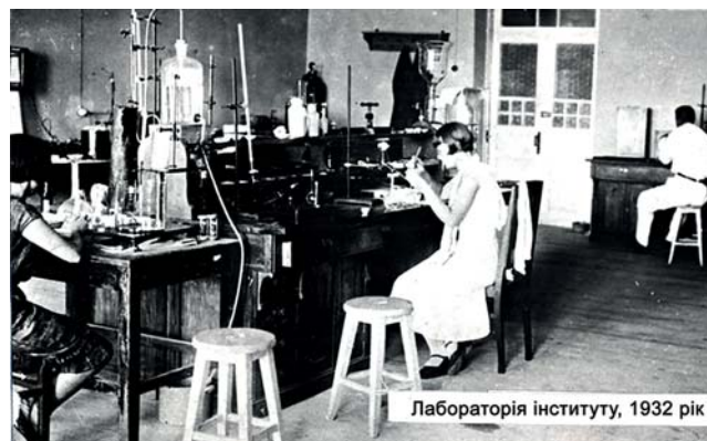
Лабораторія інституту, 1932 рік

З 1945 р. інститут став відділенням Академії архітектури України, а з 1 серпня 1947 р. перейшов на самостійний баланс з назвою Науково-дослідний інститут будівельних матеріалів Академії архітектури України.