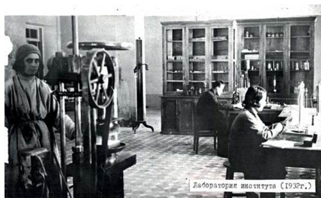
Лабораторія інституту (1932р.)