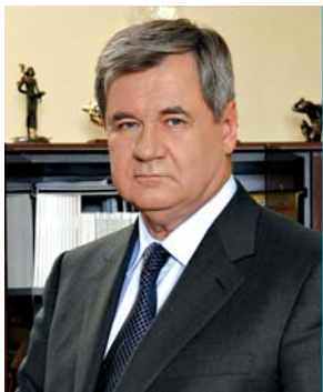
Яцуба В.Г., Президент Асоціації «Всеукраїнський союз виробників будівельних матеріалів та виробів»

Щиро вітаємо трудовий колектив з 85-річчям створення Українського науково-дослідного та проектно-конструкторського інституту будівельних матеріалів та виробів.