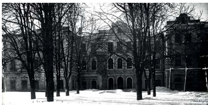
Будівля НДІБМВ по вул. Єлизаветинській 5, 1931-1946 рр.

До весни 1930 р. в інституті було створено три лабораторії: керамічна, в'язучих матеріалів та хіміко-аналітична. В одному з підвалів будинку №12 по вул. Коцюбинського, де розташовувався інститут, для випалу керамічних виробів збудували горно, паливом для якого були дрова. Пресового обладнання для випробування матеріалів на міцність інститут не мав, і тому такі випробування проводили в учбових лабораторіях кафедри силікатів Київського політехнічного інституту. В подальшому організовано невелику механічну майстерню, однією з першочергових задач якої стало виготовлення пресу для випробувань матеріалів.