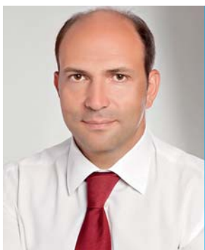
Лев Парцхаладзе, Президент КБУ