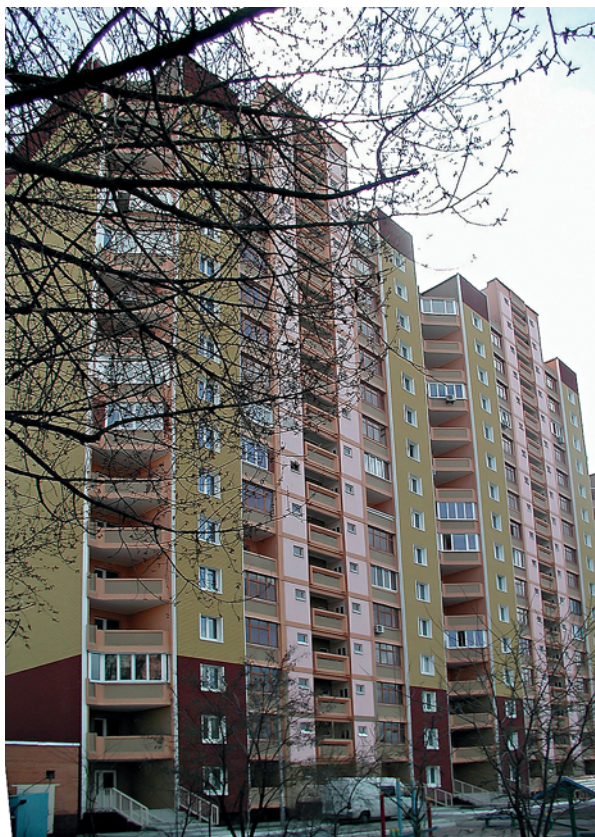
Рис. 1. Перший експериментальний житловий будинок серії АПВС К-134 з теплоventильованим фасадом по вул. Тимошенко, 15 в м. Києві

Таким чином, впровадження повного комплексу передової гнучкої технології на одному й тому ж заводі надасть можливість виробництва різних конструктивних систем, що дозволить урізноманітнити номенклатуру виробів індустріального домобудування і в цілому покращити якість масового будівництва.