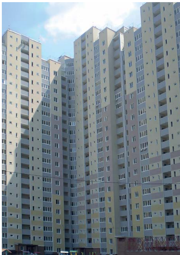
Рис. 2. Житловий будинок нової модернізованої серії АПВС К-134 «М» з теплоventильованим фасадом по вул. Закревського, 97 в м. Києві