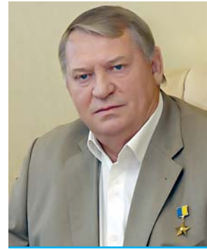
Шиліук П.С., Президент Будівельної палати України, Герой України

Щиро бажаю всім миру, процвітання, стабільності, щастя і благополуччя!