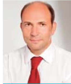
Лев Парцхаладзе, Президент КБУ