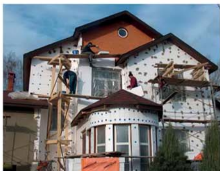
Сохрани тепло в доме

Из всего комплекса мероприятий, которые обеспечивают значительное улучшение характеристик энергетической эффективности дома, эксперты прежде всего отмечают качественную теплоизоляцию фасадов, что уменьшает расходы на отопление дома на 60%, а на кондиционирование в 3-5 раз. Статистика показывает, что в холодную погоду из зданий и сооружений уходит до 40-60 % тепла.