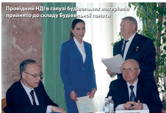
Провідний НДІ в галузі будівельних матеріалів прийнято до складу Будівельної палати

Президент Будівельної палати України, Герой України Петро Степанович Шилюк, який виступив з аналізом ситуації заявив, що галузь пережила дуже складний і не передбачуваний 2015 рік. Зараз дуже важливо оцінити його підсумки об'єктивно. Йшлося про зниження в минулому році обсягів будівельної продукції в цілому. «Проводити системну перебудову відносин в будівельній сфері в нинішній соціально-економічній ситуації складно, але іншого виходу ні у нас, ні у держави нема» – заявив Президент Будівельної палати. Результати роботи будівельників з початку року вселяють певний оптимізм, спостерігається зростання обсягів будівництва і цю позитивну тенденцію необхідно розвивати. Але будівництво потребує підтримки з боку держави, адже галузь розвивається в дуже непростий час. Була відзначена важливість посилення регіонального представництва Будівельної палати, для підтримки іміджу будівельної галузі.