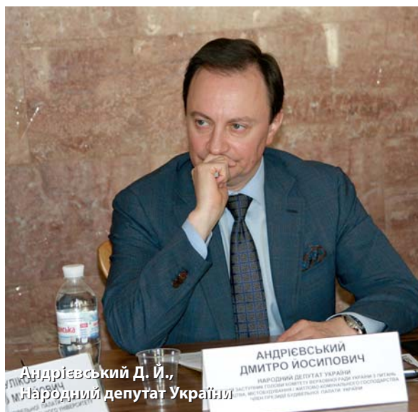
Андрієвський Д. Й., Народний депутат України

законодавчих актів дасть серйозний поштовх розвитку галузі та стане локомотивом для розвитку економіки країни. Також сподіваємось на плідну співпрацю із новим Кабінетом Міністрів» – зазначив Перший заступник профільного комітету. Відповідаючи на пропозиції учасників засідання щодо посилення ролі Мінрегіонбуду в стабілізації діяльності будівельників України, Д.Й.Андрієвський заявив, що Комітет розуміє проблему і працює в цьому напрямку. Свого колегу підтримав голова підкомітету з питань будівництва та архітектури цього Комітету О.О. Марченко, за словами якого підтримка Будівельної палати сьогодні є надзвичайно актуальною. Комітет разом з Мінфіном зробив розрахунки: з 1 млрд. грн бюджетних коштів вкладених у будівельну галузь впродовж двох років державі повертаються понад 900 млн. гривень, і ми повинні доводити це Уряду. «Дайте будівельникам можливість будувати і вони повернуть всі гроші державі» - зазначив О.О.Марченко.