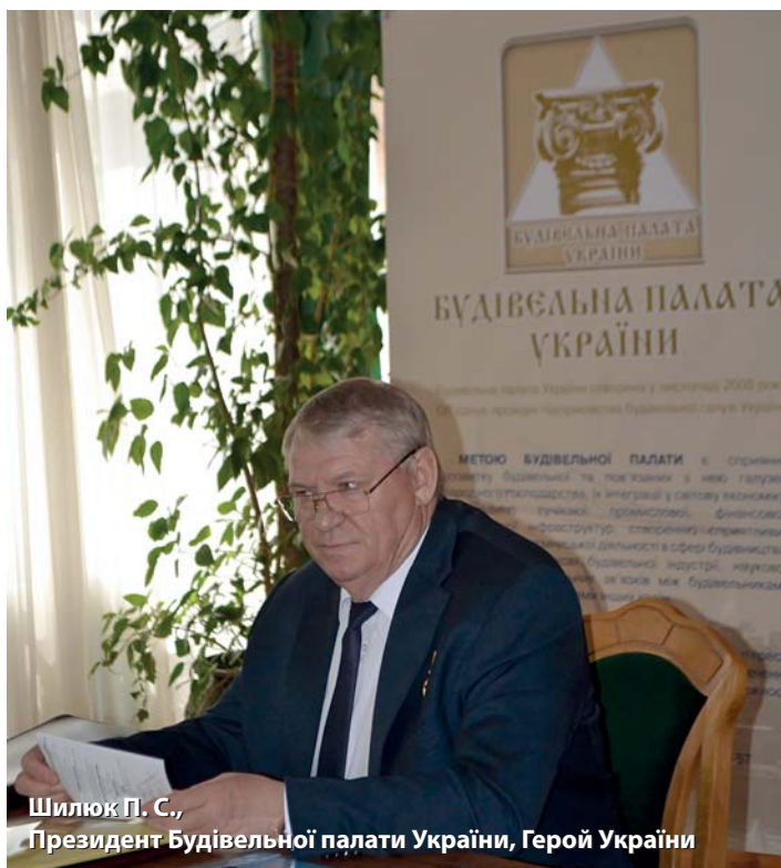
Шилюк П. С., Президент Будівельної палати України, Герой України

27 квітня 2016 року у приміщенні Київського Національного університету будівництва та архітектури відбулося засідання Президії Будівельної палати України, в якому взяли участь члени Президії – керівники провідних будівельних компаній, науково-дослідних і проектних організацій, навчальних закладів, представники ЗМІ, що висвітлюють будівельну тематику. Активну участь в обговоренні питань порядку денного взяли народні депутати України, представники організацій – партнерів. Центральне місце на засіданні зайняло обговорення питання стану справ у будівництві в сучасних умовах та ролі організацій-членів Будівельної палати щодо вирішення нагальних питань.