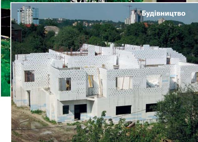
м. Київ Завершений проект

03040, г. Киев, ул. Ломоносова, 8-6 +38 (044) 501 66 55