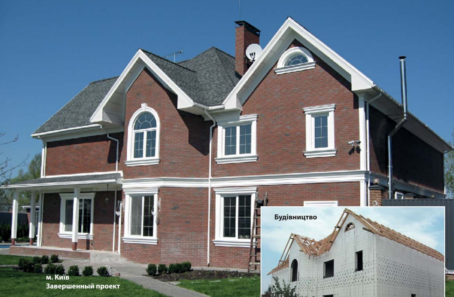
м. Київ Завершений проект