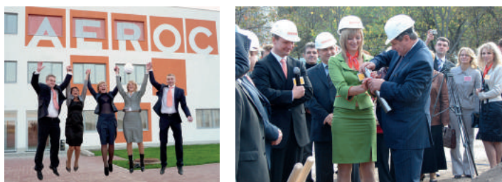
Запуск завода в 2008 года в г. Березань

Время необратимо, но любая круглая дата во все времена привлекала к себе особое внимание. Потому что символизировала она определенный этап, можно сказать, эпоху. И внешне ничем не примечательное число вдруг становилось значимым, разграничивающим до и после, той точкой, с которой нужно осмыслить уже ставшее историей вчера, и начать движение к тому, что сегодня пока только завтра. Это можно сказать о любом юбилее применительно к нации, государству, человеку или процветающей компании. Особенно это заметно в период неоднозначных перемен, когда причин для радости не так уж и много. Поэтому двойной юбилей заводов по производству газобетонных изделий компании «Аэрок» – двадцатипятилетие Обуховского и десятилетие Березанского – хоть и не стал пока общенациональным праздником (как отмечаемый в эти же даты День строителя), был все же заметным событием для сферы производства строительных материалов.