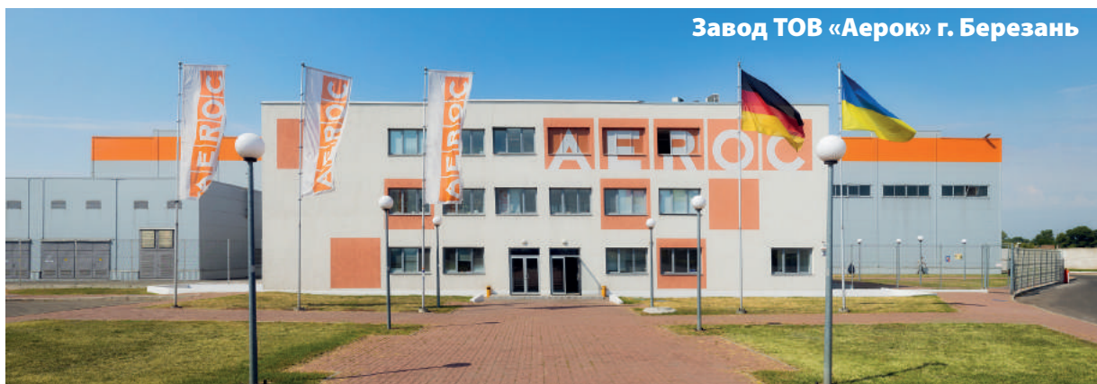
Завод ТОВ «Аерок» г. Березань

С тех пор технология производства постоянно совершенствовалась – блоки становились все легче и теплее при сохранении всех остальных физико-технических параметров, и, как шутят заводчане, скоро они будут «производить воздух с параметрами огнеупорного кирпича». Здесь лишь доля шутки, ведь сейчас на предприятии выпускают конструкционно-теплоизоляционные блоки плотностью D300, а проведенные недавно огнеупорные испытания подтвердили способность газобетонных блоков AEROC выдерживать тысячеградусную температуру в течение трех часов без ущерба для других характеристик изделия. При строительстве дома из такого газобетона, для обеспечения действующих в Украине норм по теплосопротивлению достаточно возведения однослойной стены шириной 300 мм. без дополнительного утепления.