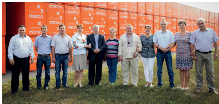
Коллектив сотрудников юбиляров на заводе в г. Обухов