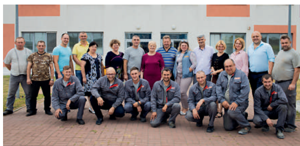
Коллектив сотрудников юбиларов на заводе в г. Березань

С тех пор технология производства постоянно совершенствовалась – блоки становились все легче и теплее при сохранении всех остальных физико-технических параметров, и, как шутят заводчане, скоро они будут «производить воздух с параметрами огнеупорного кирпича». Здесь лишь доля шутки, ведь сейчас на предприятии выпускают конструкционно-теплоизоляционные блоки плотностью D300, а проведенные недавно огнеупорные испытания подтвердили способность газобетонных блоков AEROC выдерживать тысячеградусную температуру в течение трех часов без ущерба для других характеристик изделия. При строительстве дома из такого газобетона, для обеспечения действующих в Украине норм по теплосопротивлению достаточно возведения однослойной стены шириной 300 мм. без дополнительного утепления.