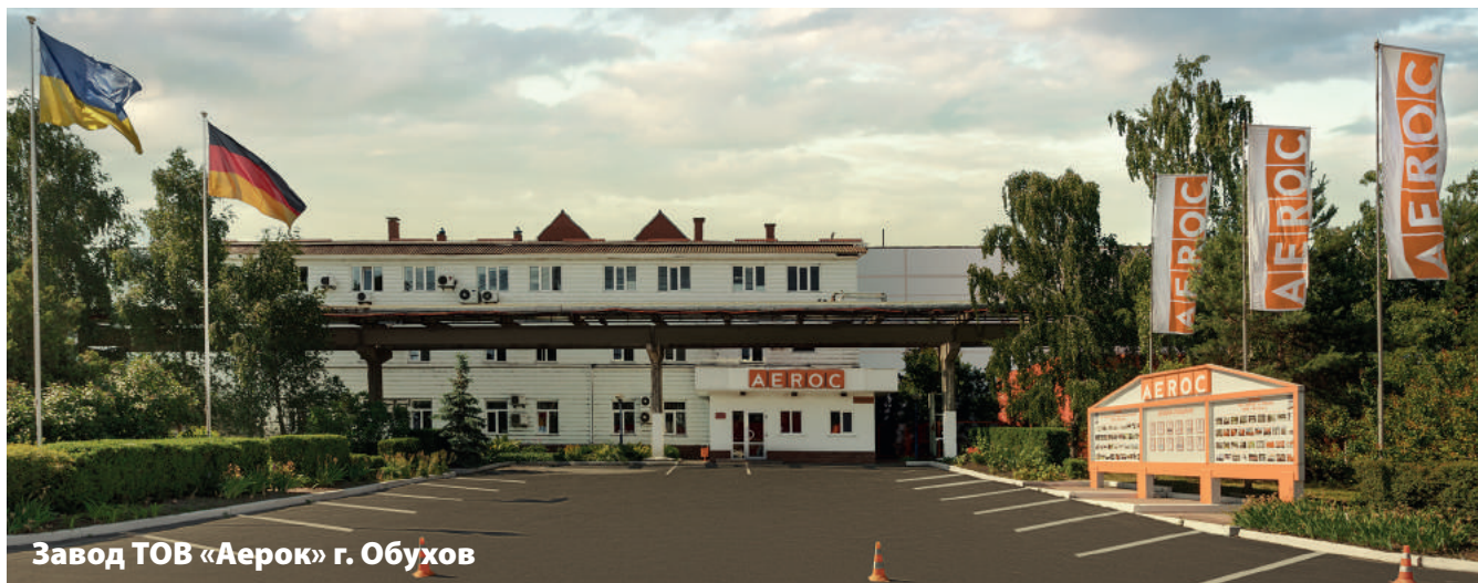
Завод ТОВ «Аерок» г. Обухов