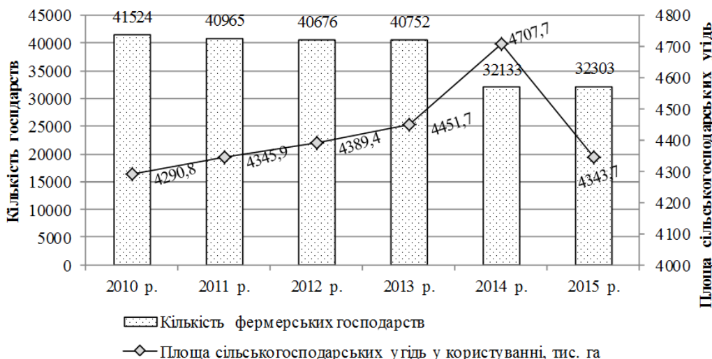
Рис. 1. Кількість фермерських господарств в Україні на кінець року та площа сільськогосподарських угідь у користуванні ними