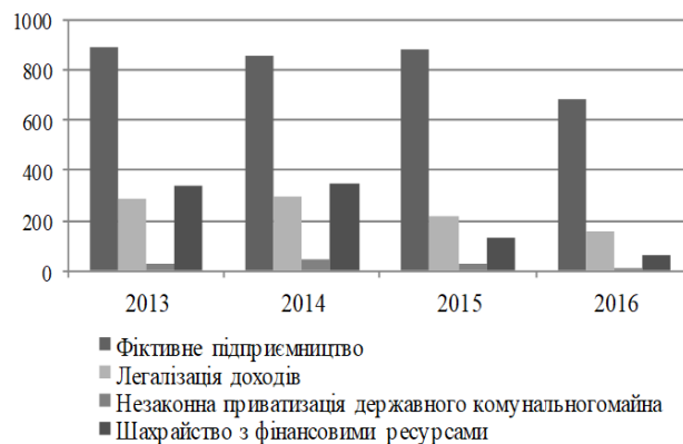
Рис.2. Кількість виявлених економічних злочинів (Bahanets', 2017)

Ці дані можуть свідчити про зниження активності правоохоронців у виявленні економічних злочинів, доказом чого є факт того, що в 2016 році обліковано всього 681 випадок фіктивного підприємництва (в той час як у 2015-му – 885, у 2014 – 858 та у 2013 – 891), 159 фактів легалізації (відмивання) доходів, одержаних злочинним шляхом (у 2015 році – 221, у 2014 – 296 та у 2013 – 291), всього 10 випадків незаконної приватизації державного комунального майна (у 2015 році – 29, у 2014 – 46 та в 2013 – 26), лише 63 випадки шахрайства з фінансовими ресурсами (у 2015 році – 133, у 2014 – 347 та в 2013 – 337) (рис. 2).