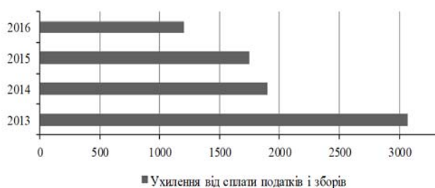
Рис. 3. Ухилення від сплати податків (Bahanets', 2017)

– 1899 та в 2013 вдвічі більше – 3069) (Ukaz Prezydenta Ukrainy, 2016) (рис. 3, рис. 4).