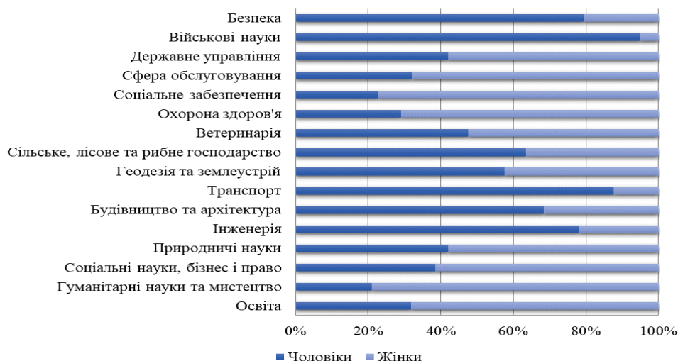
Рис. 2. Розподіл студентів закладів вищої освіти України за галузями знань та гендерною ознакою, початок 2017/18 навчального року, % ( Vyshcha osvita v Ukraini u 2017 rotsi )

3) надання суб’єктам навчально-виховного процесу повної та вичерпної інформації щодо можливості професійного визначення відповідно до особистісних здібностей та інтересів, без обмеження їхньої свідомості рамками “жіночих / чоловічих” професій ( Stratehiia uprovadzhennia hendernoi rivnosti ).