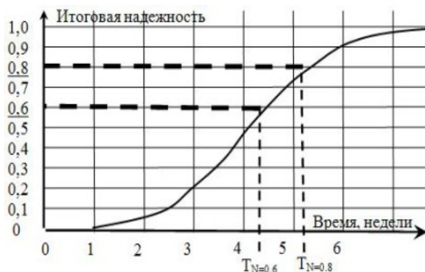
Рис. 3. Итоговая функция времени окончания работ Fig. 3. The final function of the work completion time

предусматривает увеличение этих сроков по отношению к детерминированным расчетам.