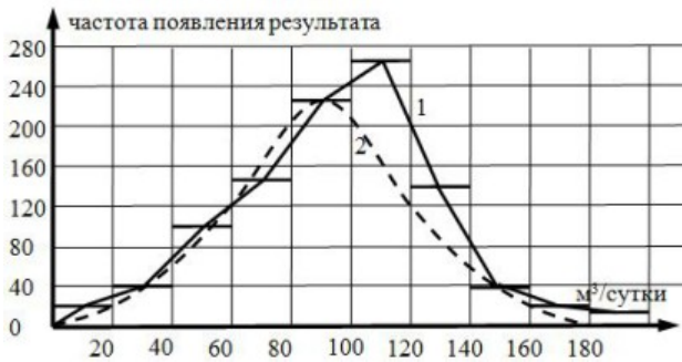
Рис. 1. Графики фактического (1) и теоретического (2) распределения вероятностей интенсивности монтажа