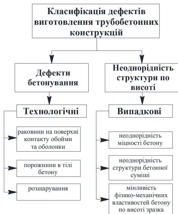
Рис. 1. Класифікація дефектів осердя трубобетонних конструкцій The classification of defects concrete core of tube confined concrete constructions

До дефектів бетонування можна також віднести недостатню адгезію, в результаті чого утворюються тріщини між бетоном та сталеву оболонкою труби, пов'язані з порушенням зчеплення між ними за деформацій зсуву, розвиваються поступово [10].