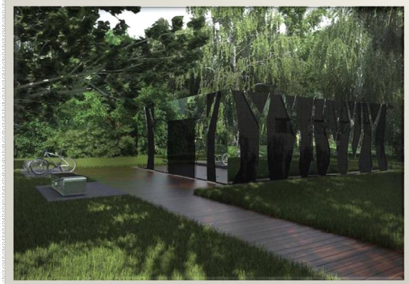
Рис.2. Вид громадського туалету, що розташований в парку відпочинку: / The view of public toilet in a recreation park

Дані споруди, вписуючись в навколишнє середовище, стають непомітні для відвідувачів, не псують зовнішнього вигляду парків тощо (Рис.2).