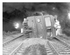
Рис. 1. Авария на железнодорожном транспорте / Accident on railway transport

практики крайне важно иметь методики расчета для оценки эффективности этого метода защиты и его оптимизации, применительно к каждой конкретной ситуации.