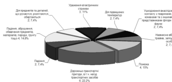
Рис.2 Розподіл смертельно травмованих за видами подій / Rozpodil of mortally trauma after kinds events

Основними видами подій, що призвели до нещасних випадків стали (рис. 2): дорожньо-транспортна пригода – 59 випадків (14,4%); падіння потерпілого – 98 (24,0%); падіння, обвалення, обвал предметів, матеріалів, породи, ґрунту 52 (12,7%); дія предметів, що рухаються, розлітаються, обертаються – 95 (23,2); ураження електричним струмом – 9 (2,2%); пожежа – 8 (1,9%).