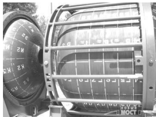
Рис. 1. Перевозка снаряженных корпусов твердотопливных ракетных двигателей РС-22 железнодорожным транспортом / Transportation of the equipped cases of solid propellant rocket engines RS-22 by railway transport

К числу наиболее опасных источников возможного химического загрязнения окружающей среды при перевозке железнодорожным транспортом относятся ракетное топливо, и в частности, твердое ракетное топливо (ТРТ) ракетной системы РС-22, которое складировано на Павлоградском химическом заводе.