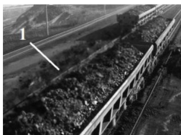
Рис. 1. Перевозка сыпучего груза железнодорожным транспортом: 1 – пылевое облако /

Transportation of bulk cargo: 1 – dust cloud