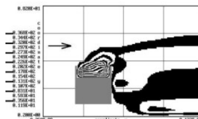
Рис. 3. Зона загрязнения атмосферы возле полувагона с сыпучим грузом /

Sketch of computational region: 1 – wind speed profile, 2 – wagon, 3 – bulk cargo