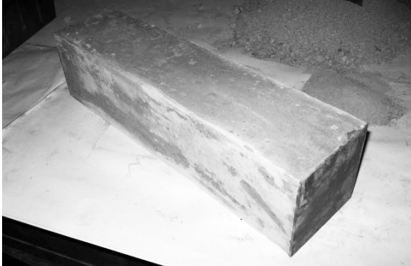
Рис. 1. Зовнішній вигляд армованого ґрунтоцементного дослідного зразка

Матеріалом армованих призм був ґрунтоцемент, виготовлений в лабораторних умовах за принципом бурозмішувальної технології з лесового суглинку з числом пластичності I_p=12\% . Природна вологість ґрунту складала W=0,18 , а щільність \rho=1,53 \text{ т/м}^3 . Портландцемент М 400 додавався у кількості 20% від ваги скелету ґрунту у вигляді цементного молока, кількість води в ньому приймалася з огляду на водоцементне відношення В/Ц=2,7 . Така величина В/Ц була прийнята для забезпечення необхідної рухливості ґрунтоцементної суміші, яка в даному досліді визначалася осіданням конусу і складала 11 см. Суміш перемішувалася до досягнення однорідності.