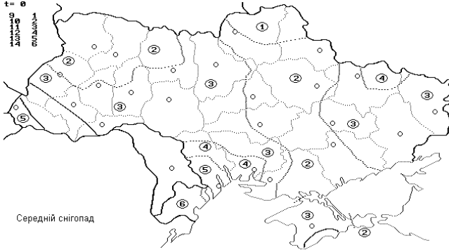
Рис. 3. Територіальна мінливість математичного сподівання величини одного снігопаду M_c

2. Розроблені карти районування відображають територіальну мінливість основних статистичних характеристик імпульсного випадкового процесу послідовності снігопадів та можуть використовуватися при нормуванні снігового навантаження і в розрахунках надійності несучих конструкцій покриттів.