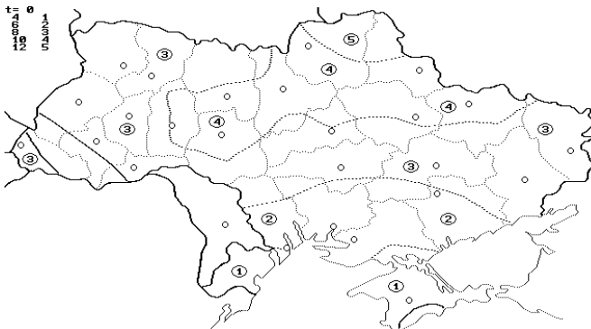
Рис. 2. Територіальна мінливість середньорічної кількості снігопадів N_C

Виявлені закономірності територіальної мінливості параметрів випадкового процесу послідовності снігопадів не лише важливі з інформаційної точки зору, але й дозволяють передбачити порівняно незначну територіальну мінливість снігового навантаження на холодні покрівлі будівель з надлишковими виділеннями тепла.