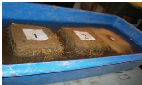
Рис. 2. Вид образцов самана и глины при испытании в воде а) – образцы перед испытанием; б) – вид образцов через сутки испытаний; в) – то же через трое суток.

1 – образец самана с соломенной резкой длиной 8...10 см; 2 – то же с длиной 4...5 см; 3 – образец из глины