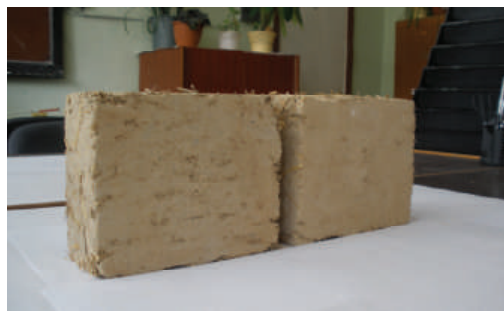
Рис. 1. Макроструктура самана (разрезанный саман)