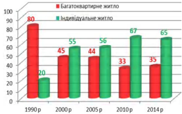
Рис. 1. Динаміка росту індивідуального житла України, % до загального об'єму будівництва / Dynamics of growth of individual housing Ukraine, % of the total volume of construction

Питома вага всіх енергозатрат та надходжень енергії від відновлювальних джерел визначає загальний баланс енергоефективності споруди (див. табл. 2). Розрахунки такого балансу енергетичних показників мають враховуватися на стадії розробки робочого проекту будинку.