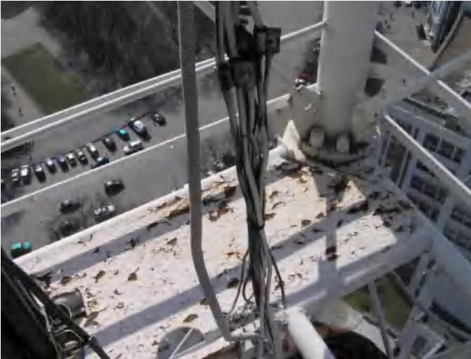
Фото 3. Состояние металлоконструкций башни на отм. 85.50 м /

State of steel structures tower on the elevation. 85.50 m