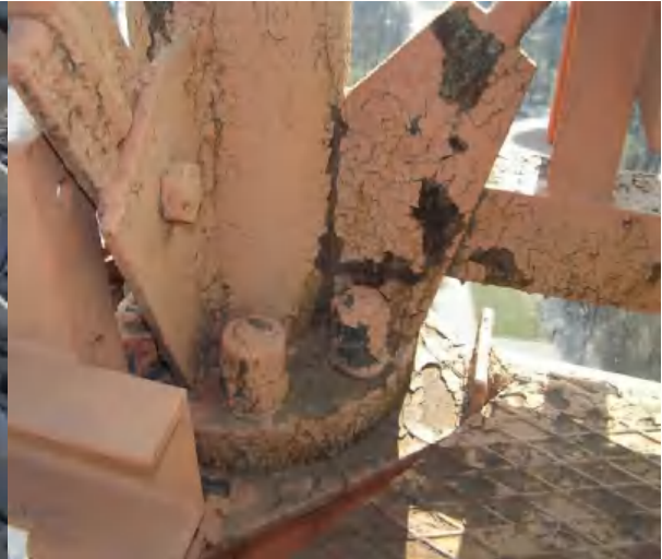
Фото 4. Фланцевое соединение элементов башни на отм. 75.00м /

На многих участках обетонировки главных металлических балок рамы произошло разрушение бетона на глубину до 100мм, оголение и коррозия хомутов от 50% до 100%.