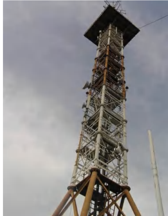
Фото 2. Металлическая телевизионная башня высотой H=32.5\text{м} /