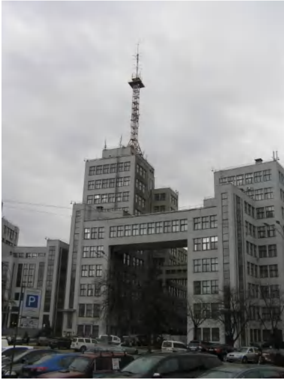
Фото 1. Общий вид башни на крыше здания Госпром / General view of the towers on the roof of Derzhprom