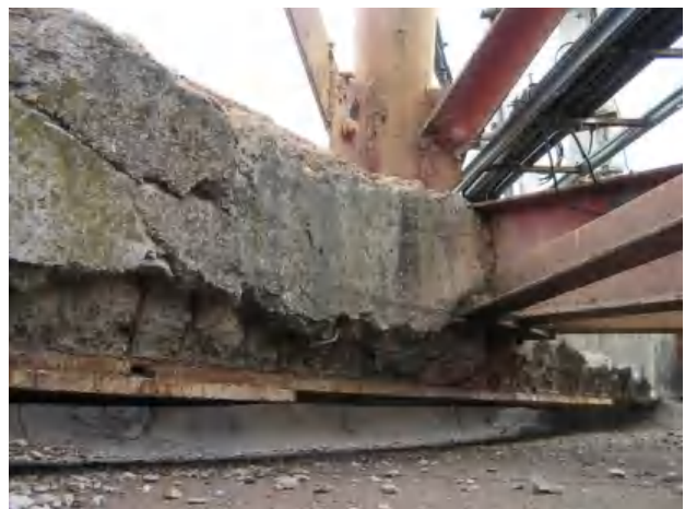
Фото 5. Разрушение обетонировки металлических балок рамы на глубину до 100мм, оголение и коррозия хомутов до 100% /

Flange connection of the elements of the tower at elevation. 75.00m