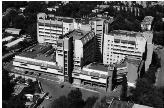
Рис. 1. Объект проектирования / Design object

каркасное здание сложной архитектурной формы (см. рис. 1). Здание хирургического корпуса состоит из девяти блоков «А, Б, В, Г, Д» (7 – 9 основных этажей плюс технический) и «Е, Ж, И, К» (2 – 3 основных этажа) (см. рис. 2). Под всем контуром здания размещен цокольный этаж и подвал. Под пристройками, соединяющими блоки, имеются сквозные проезды