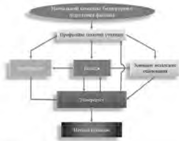
Рис.1. Принципова схема створення регіонального навчального комплексу

Викладення основного матеріалу. За структурою пропонується декілька етапів реформи освіти із впровадженням передових технологій в системі навчання. Головна ідея і мета першого етапу реформи: на базі розрізаних навчальних закладів I-го ... 4-го рівнів акредитації, створити регіональні навчальні комплекси (РНК) з єдиною наскрізною програмою навчання для отримання відповідної професійної кваліфікації світового рівня(рис.1).