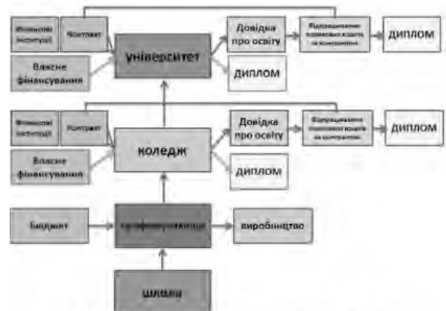
Рис.3. Схема реалізації другого етапу освіти

кроком реалізації методології підготовки фахівців є задача реорганізувати систему управління і фінансування, запровадження інституційної, академічної і фінансової автономії регіональних навчальних комплексів. Основною передумовою підвищення якості освіти реалізується шляхом переходу від державного замовлення до контрактної форми оплати у вигляді позики на весь період навчання з поверненням коштів відповідним відпрацюванням (рис.3).