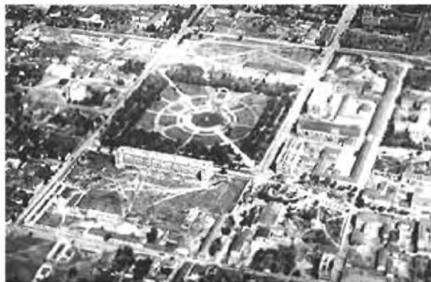
Рис. 3. Аэрофотосъёмка района парка Ленина. Сер. 1940-х гг. / Aero photo of neighborhood of Park Lenin. Mid. 1940s.

В послевоенное время парк получает новую функциональную составляющую. Появляются детские площадки, аттракционы, танцплощадка, фонтан, начинает работу шахматный клуб. Постепенно территория засаживается деревьями, и площадь превращается в небольшой парк в центральной части Кировограда, площадью около 8 га. При озеленении парка использованы разные виды хвойных и декоративных лиственных пород деревьев, а также разные кустарники, всего около тридцати древесных и кустарниковых пород, в том числе достаточно редкие. Как один из старейших парков города, в 1972 г. парк «Ковалевский» получил статус парк – памятник садово-паркового искусства местного значения.