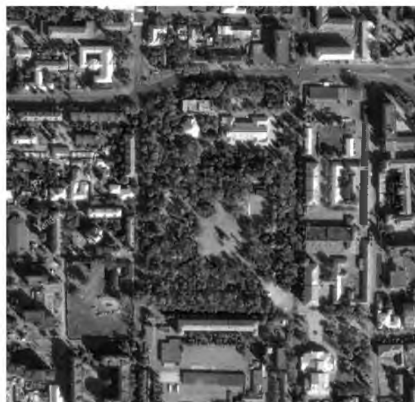
Рис. 4. Современное состояние в районе Ковалевского парка. Спутниковая съёмка / The current state of neighborhood of Kovalevskiy park

В последнее время на территории парка произошёл ряд изменений, нарушивших сложившуюся планировку парка и приведший к потере части насаждений. Так недалеко от здания филармонии был открыт ледовый клуб, который однако, вскоре пришёл в запустение, а на месте танцплощадки началось сомнительное строительство.