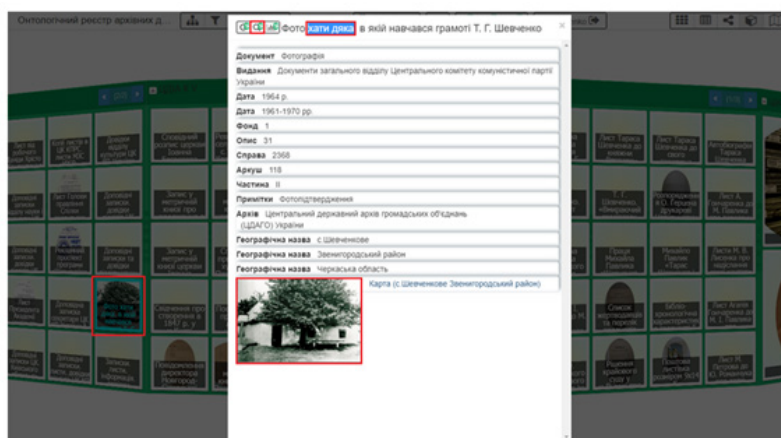
Рис. 1. Фото хати дяка, в якій навчався Т. Г. Шевченко

У роботі «Т. Шевченко у дяка в науці» художник [Киянченко Георгій Васильович] використав прийом гротеску, показуючи епізод з життя малого Тараса в іронічному ключі, як його