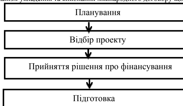
Схема 1. Механізм укладення та виконання міжнародного договору щодо залучення МТД.

З метою координації всієї роботи щодо залучення, розподілу, перерозподілу та цільового і ефективного використання МТД постановою Кабінету Міністрів України «Про створення єдиної системи залучення, використання та моніторингу міжнародної технічної допомоги» від 15.02.2002 р. №153 затверджено Порядок залучення, використання та моніторингу міжнародної технічної допомоги (далі по тексті - Порядок). Вважаємо за можливе процес укладення такого міжнародного договору, його реалізація, розподіл коштів та їх цільове використання можна розділити на окремі послідовні етапи (Схема 1).