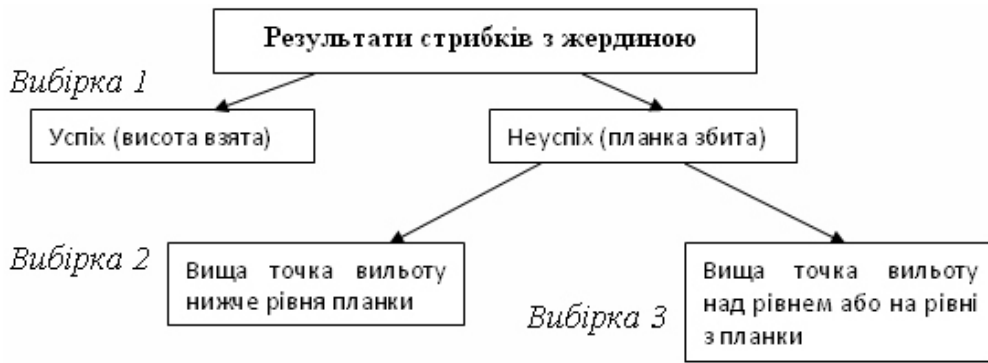
Рис. 1. Схема можливого результату стрибка і вибірки по параметрах