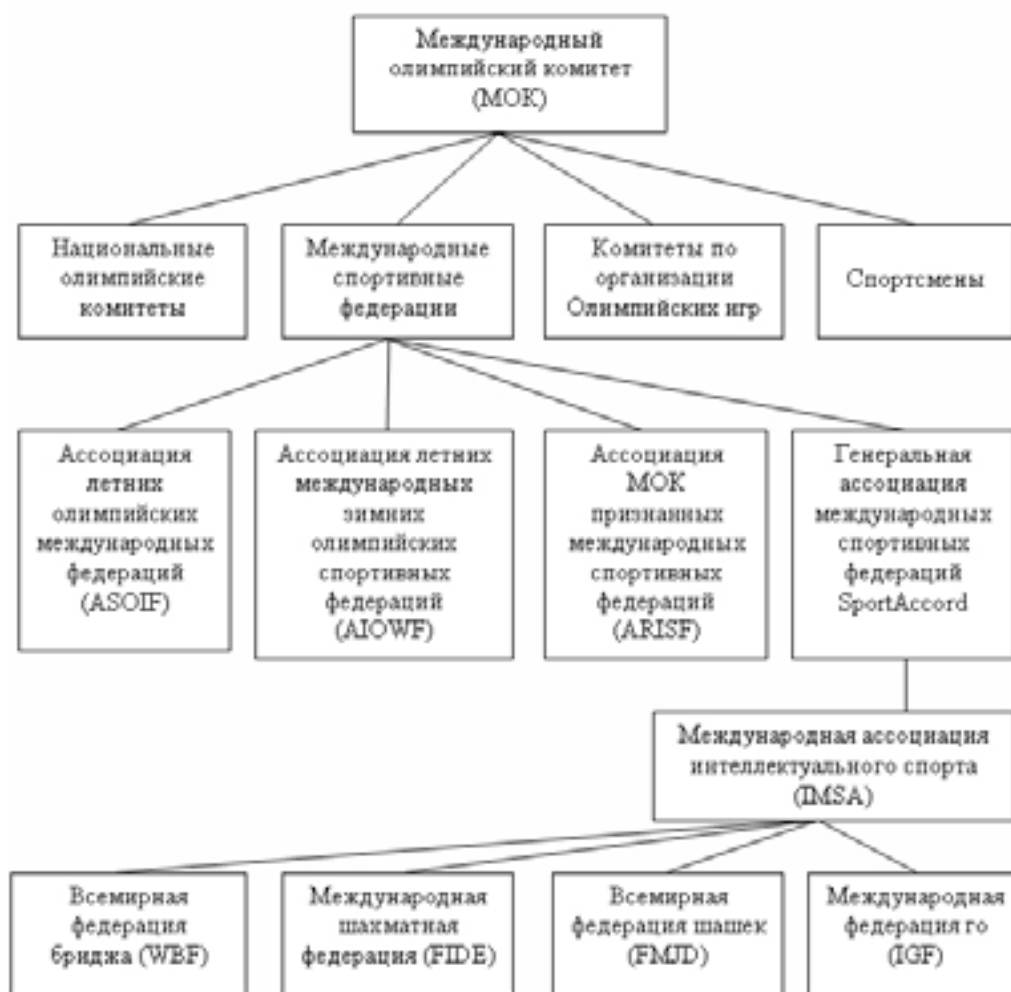
Рис. 1. Блок-схема иерархической структуры управления столклеточными шашками на международном уровне

генерального секретаря, казначея. Президент председательствует на каждом заседании исполнительного комитета. В организационной структуре IMSA также есть Комиссия игроков, которая состоит из двух представителей каждого вида спорта, предпочтительно мужчины и женщины. Она выполняет консультативную работу по вопросам размещения и организации Всемирных интеллектуальных спортивных игр и мероприятий, организованных Международной ассоциацией интеллектуального спорта.