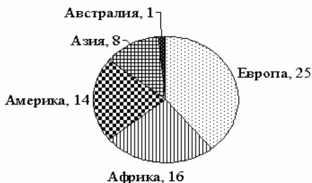
Європа Африка Америка Азія Австралія