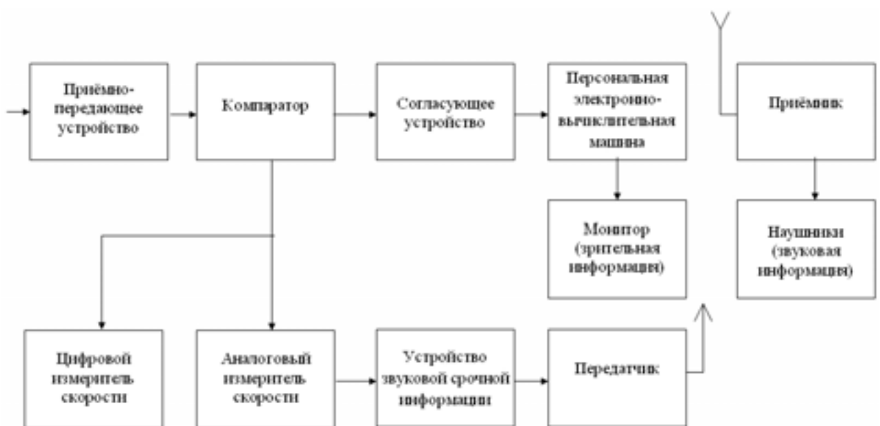
Рис. 1. Функциональная схема радиолокационной системы регистрации скорости бега со звуковой и зрительной срочной информацией

Главным фактором, определяющим спортивный результат в легкоатлетических метаниях, является начальная скорость вылета снаряда. Причем теоретически скорость вылета можно увеличивать без ограничения, поскольку она зависит от уровня развития скоростно-силовых качеств и технического мастерс-