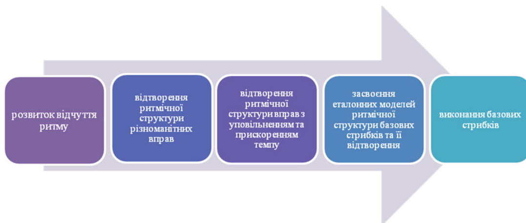
Рис. 1. Структурна модель програми навчання базових стрибків у гімнасток на етапі початкової підготовки

– використання різних звукових сигналів (рахунок, стук), які підказують моменти виконання окремих