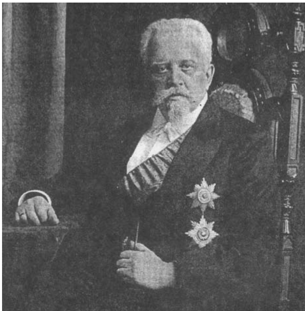
Рисунок 1 – Тиме Иван Августович

В 2013 году исполняется 175 лет со дня рождения Ивана Августовича Тиме (1838 – 1920 гг.). Он является одним из наиболее талантливых и ярких учёных в области горной механики и машиностроения, рождённых эпохой XIX века. Вторая половина этого века характеризовалась ускоренными темпами развития промышленности России.