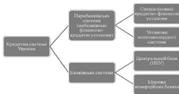
Рис. 1. Місце небанківських фінансово-кредитних установ у загальній кредитній системі України

З рис. 1 ми бачимо, що небанківські фінансово-кредитні установи належать до другого рівня кредитної системи України, їх також називають парабанками, вони виконують деякі функції банків. Виникнення фінансового посередництва в Україні зумовлено розвитком ринкової економіки. Об'єктивно необхідним явищем для ефективного функціонування ринкової економіки є небанківські фінансові посередники. Вони у свою чергу беруть на себе надання суб'єктам господарювання специфічних послуг, виконання чи надання яких є для банків не вигідним чи законодавчо забороненим, саме це надає велику перевагу даним установам, оскільки зумовлює їхню конкуренцію з банками у боротьбі за вільні грошові капітали.