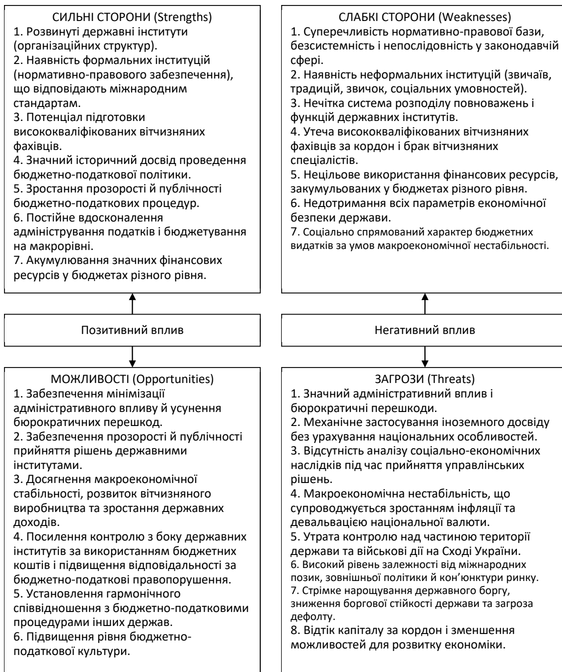
Рис. 4. SWOT-аналіз бюджетно-податкової політики України

Одним із найважливіших напрямів бюджетно-податкової політики в Україні у 2013–2017 рр. була політика бюджетного дефіциту, що пов'язано з наявністю значного розриву між бюджетними надходженнями та витратами (рисунок 3).