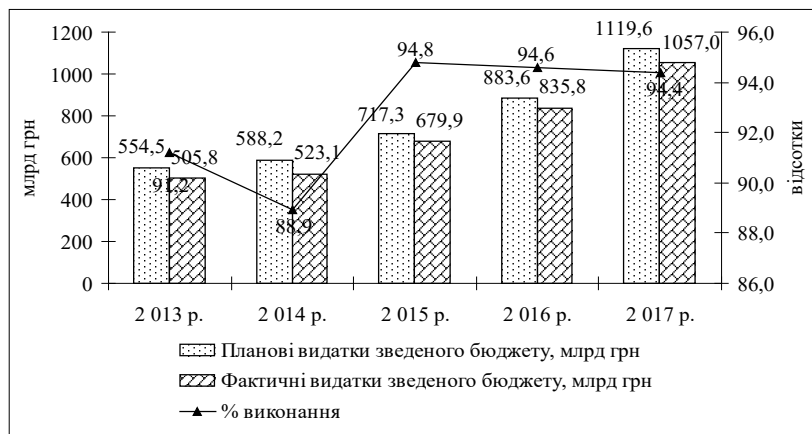
Рис. 2. Рівень виконання зведеного бюджету України за видатками у 2013–2017 рр.

гове оподаткування, реструктуризацію податкової заборгованості, надання податкових розстрочень і відстрочень. На практиці це проявилось в списанні фінансових санкцій, нарахованих за несвочасну сплату податкових платежів підприємствами окремих галузей національної економіки. В умовах обмеженості бюджетних коштів такі дії для економіки стали деструктивними факторами її розвитку, а для держави – зайвими бюджетними втратами [5, с. 74]. Зростання видатків зведеного бюджету на соціальну сферу, зокрема духовний і фізичний розвиток, освіту й охорону здоров'я, зумовлено зростанням посадових окладів працівників бюджетної сфери, а також підвищенням цін на продукти харчування та медикаменти, зростанням тарифів на житлово-комунальні послуги, що збільшили вартість утримання установ соціальної сфери.