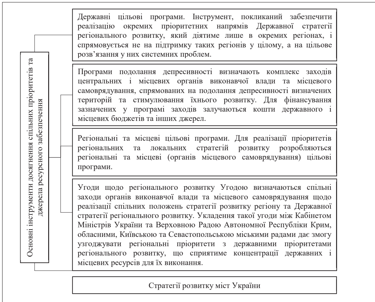
Рис. 2. Основні інструменти досягнення спільних пріоритетів та джерела ресурсного забезпечення (розроблено на основі [2])

– Пріоритетний розвиток галузей споживчого і забезпечуючого призначення, на основі існуючого та новостворюваного промислового потенціалу ВЕС регіону. Переорієнтація виробництва ВЕС на вирішення першочергових проблем забезпечення продуктами харчуванням,