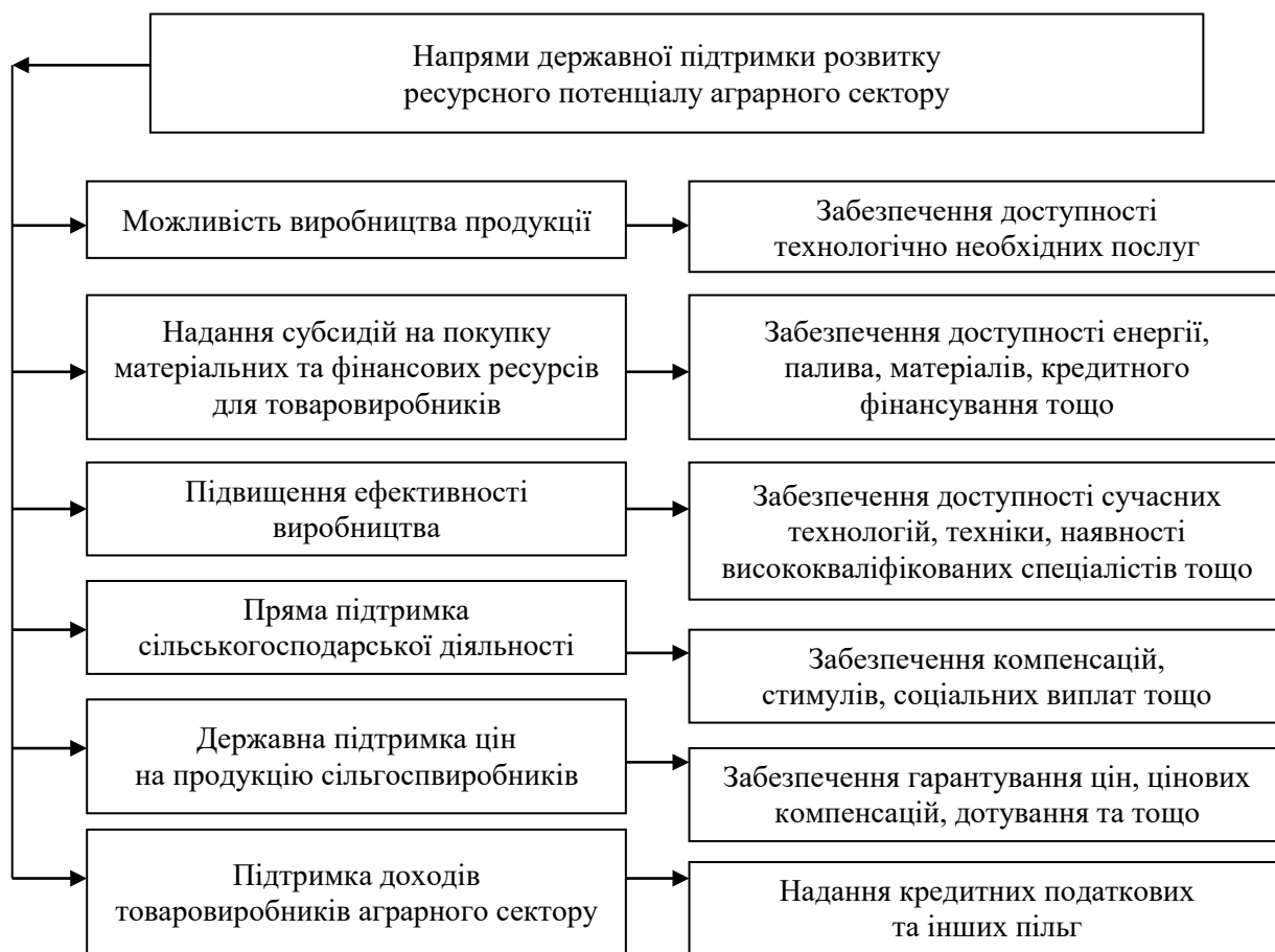
Рис. 1. Основні напрями використання державної підтримки розвитку ресурсного потенціалу аграрного сектору

– оцінка стану системи – визначаються кількісні і структурні невідповідності цільовим характеристикам, виявляються їх причини, визначаються напрями відтворювальної діяльності з урахуванням усунення виявленої асиметрії;