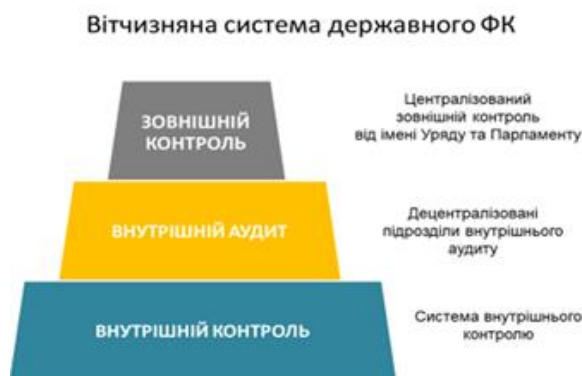
Мал. Елементи системи державного внутрішнього фінансового контролю

Здійснюється Міністерством фінансів України, Державною казначейською службою, Державною аудиторською службою та іншими органами.